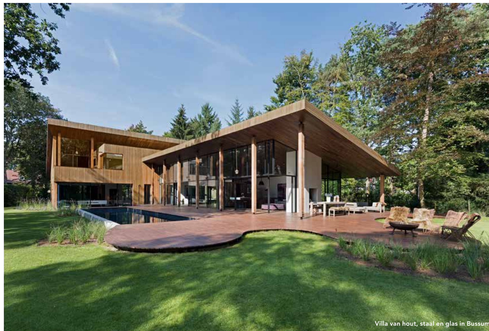
Villa van hout, staal en glas in Bussum