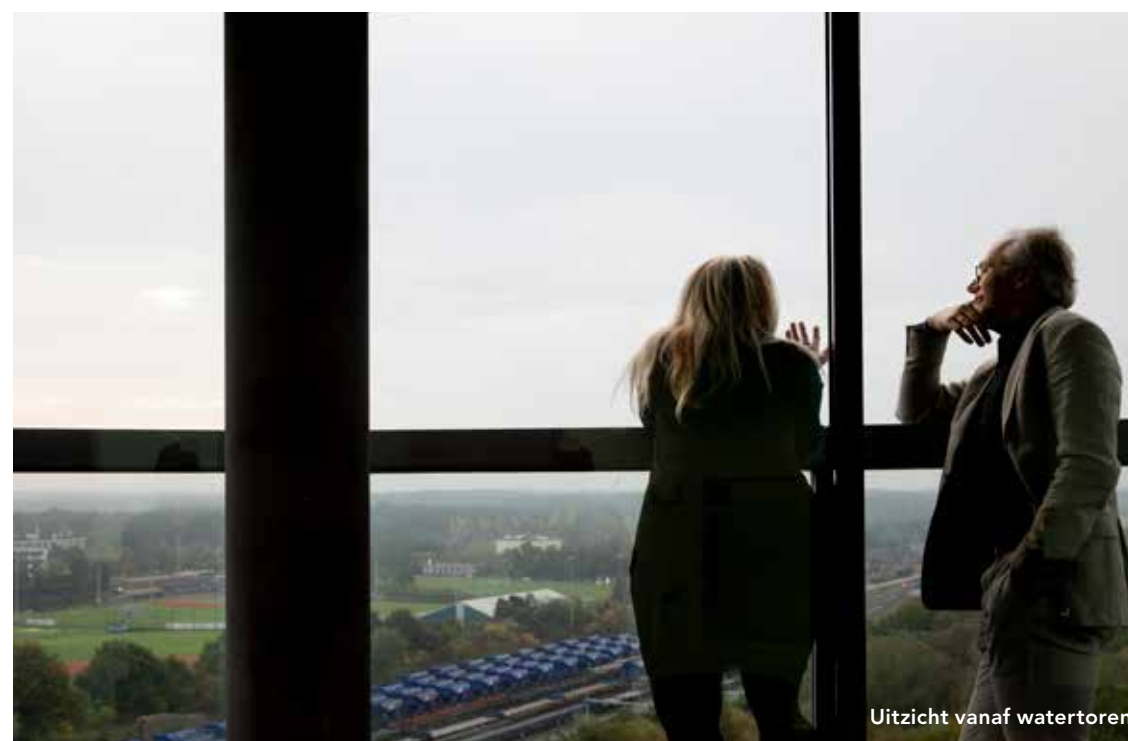
Uitzicht vanaf watertoren